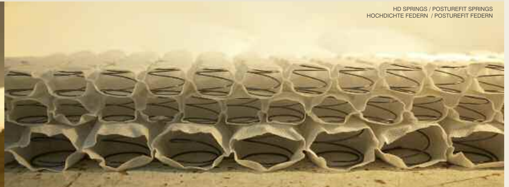
HD SPRINGS / POSTUREFIT SPRINGS HOCHDICHTE FEDERN / POSTUREFIT FEDERN