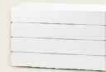
Mary drawer Mary Schublade