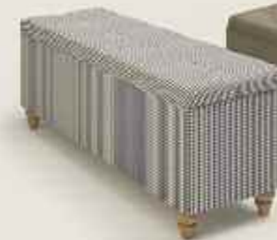
Fantasy storage box Fantasy Bettbox