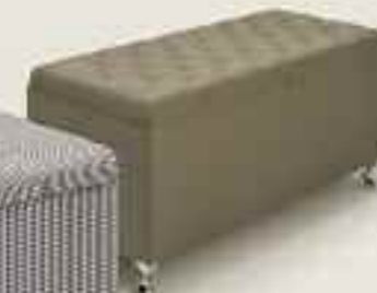
Mysterious storage box Mysterious Bettbox