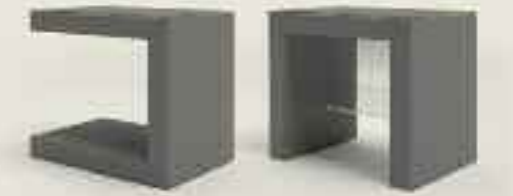
Monogram nightstand Monogram Nachttisch Logic nightstand Logic Nachttisch