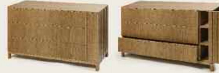
Ada drawer Ada Schublade