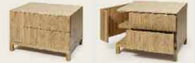
Ada nightstand Ada Nachttisch