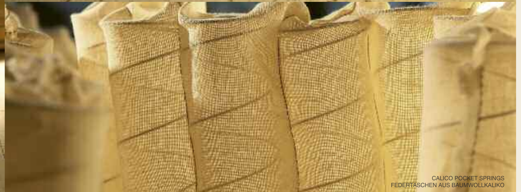
CALICO POCKET SPRINGS FEDERTASCHEN AUS BAUMWOLLKALIKO