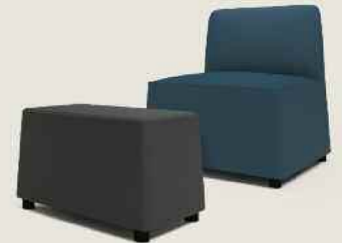
Harriet footrest Harriet Fußstütze