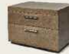
Johan nightstand Johan Nachttisch